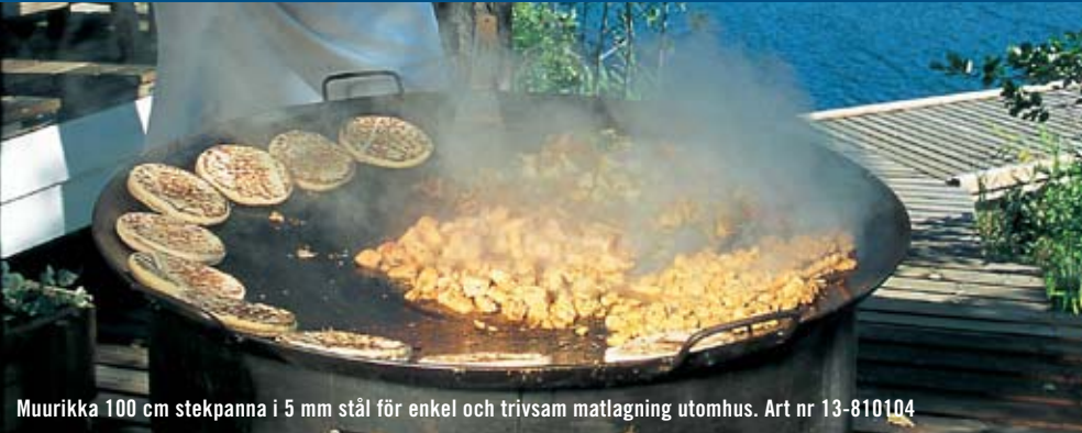
Muurikka 100 cm stekpanna i 5 mm stål för enkel och trivsamt matlagning utomhus. Art nr 13-810104